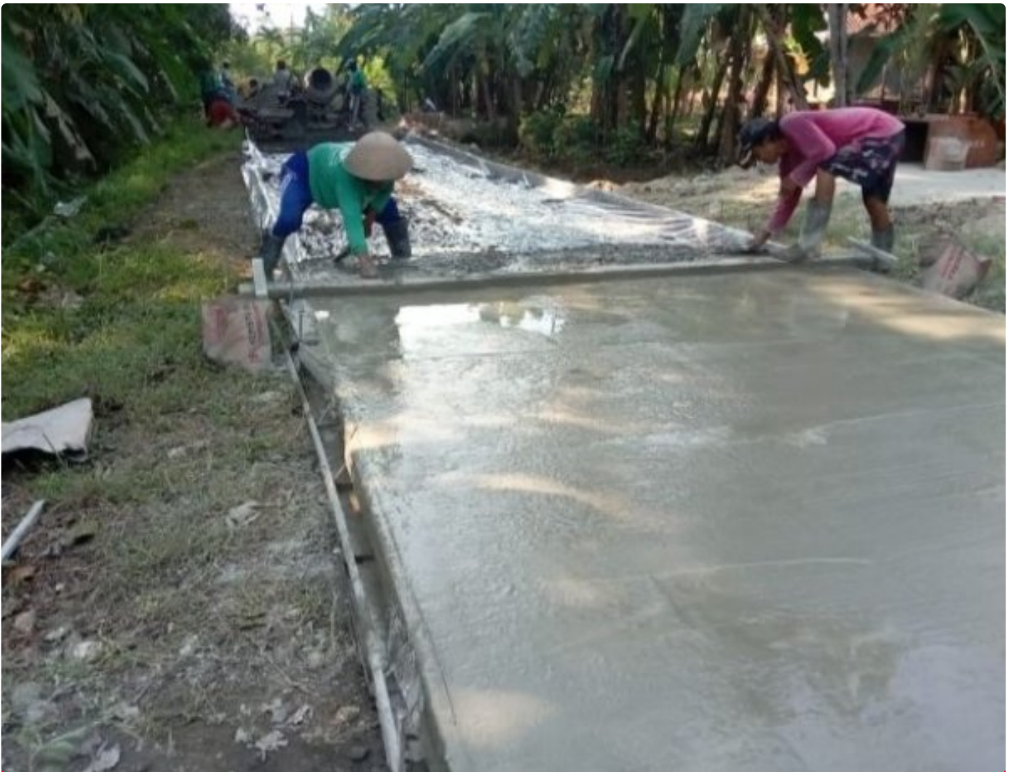
Pembangunan insfrastruktur Jalan Rabat Beton di Desa Rejamulya

REJAMULYA - Pemerintah Desa Rejamulya, Kecamatan Kedungreja, Kabupaten Cilacap melaksanakan Pembangunan Rabat Beton Jalan Lingkungan di Dusun